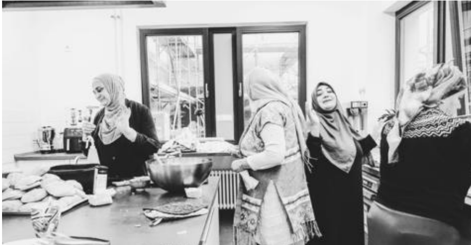
Nachbar*innen und ehrenamtliche Unterstützer*innen beim Zubereiten der Speisen vor dem Richtfest.

Den etwas sperrigen und langen Projektnamen "Auf-und Ausbau von Ehrenamtsstrukturen für Geflüchtete" ersetzen wir ab sofort mit der knackigeren Version "DabeiSein". Denn der Name umfasst genau, worum es geht – nämlich bei Angeboten im OPZ, bei Veranstaltungen im Brunnenviertel oder bei Aktionen im Gesundbrunnen dabei zu sein. Wir laden alle herzlich ein, sich einzubringen, zu unterstützen und sich zu engagieren! Die Namensumänderung ergab sich im Zuge der Austauschrunde mit Kolleg*innen anderer Bezirke, mit demselben Auftrag.